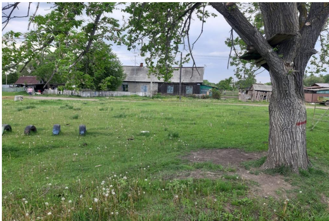
Площадка после выполнения работ