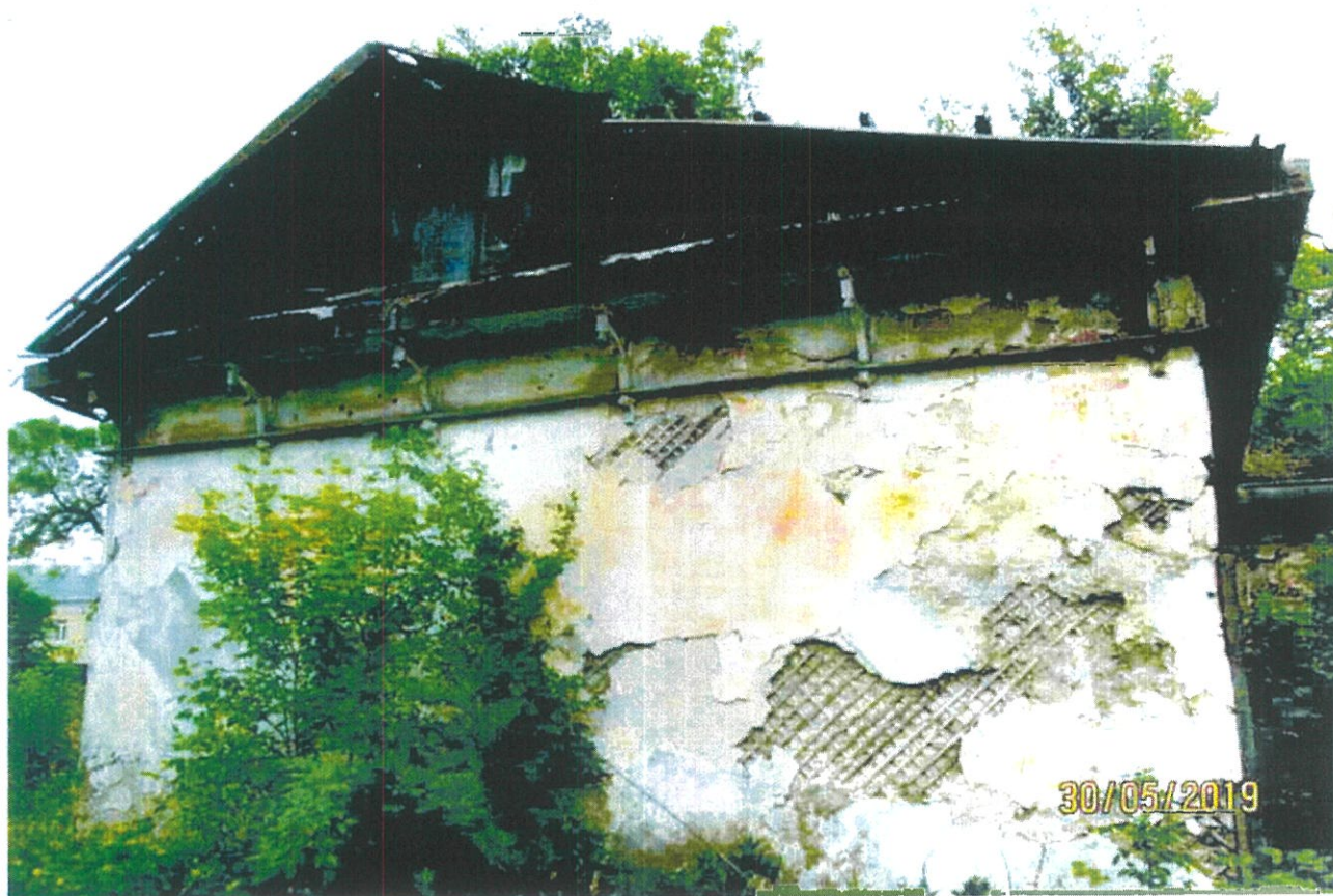
Фото 5. Фрагмент северо-западного фасада