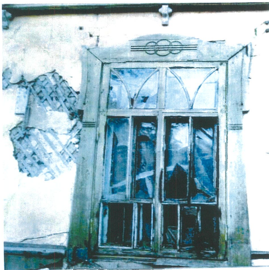
Фото 10. Обрамление оконных проемов резными деревянными наличниками, подлинная расстекловка