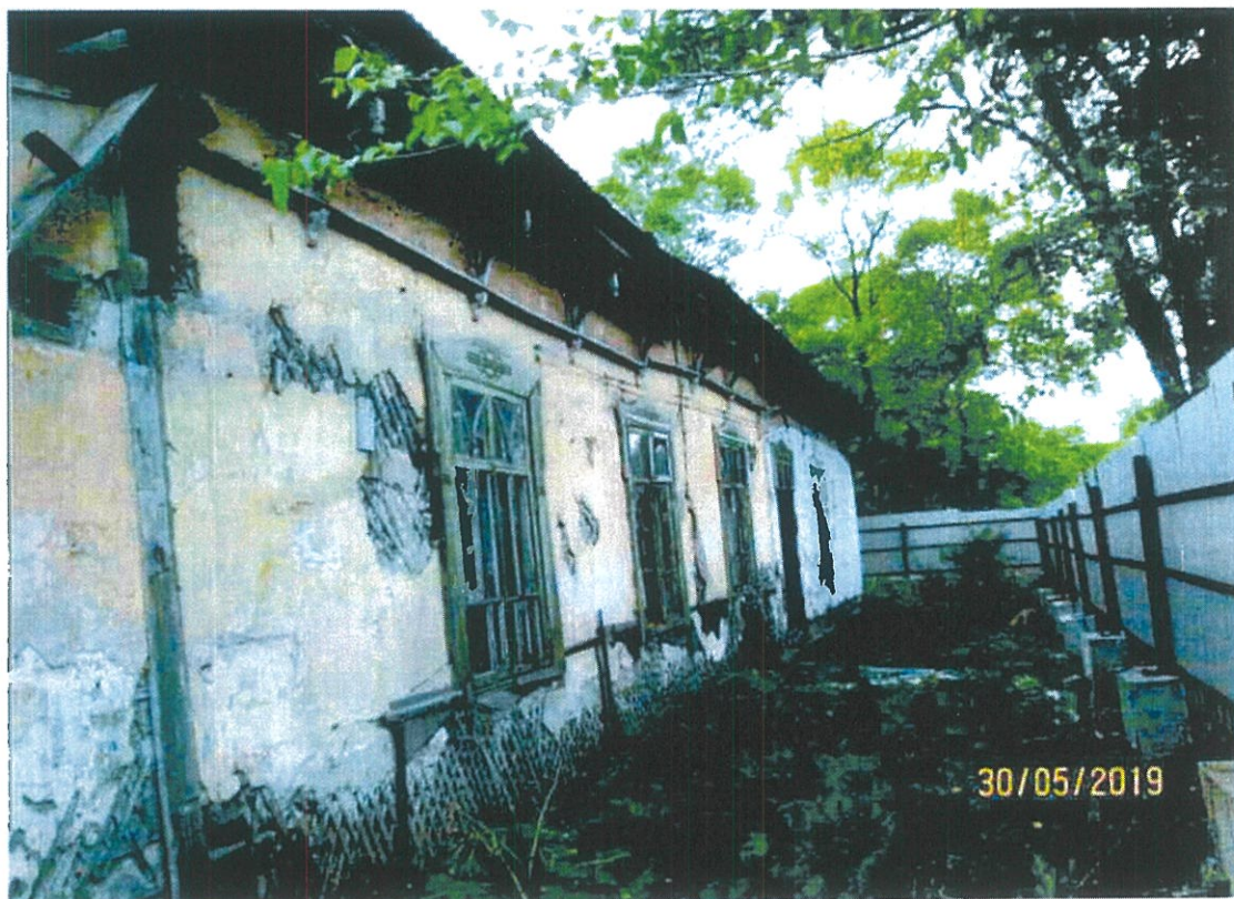
Фото 3. Фрагмент юго-западного фасада (со стороны Строительного переулка)