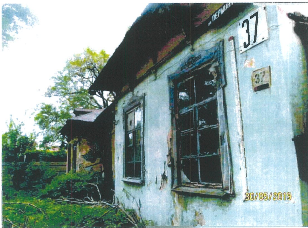
Фото 1. Фрагмент юго-восточного фасада (по ул. Лермонтова)

«Жилой объект военного ведомства (дом генерала)», 1903г.