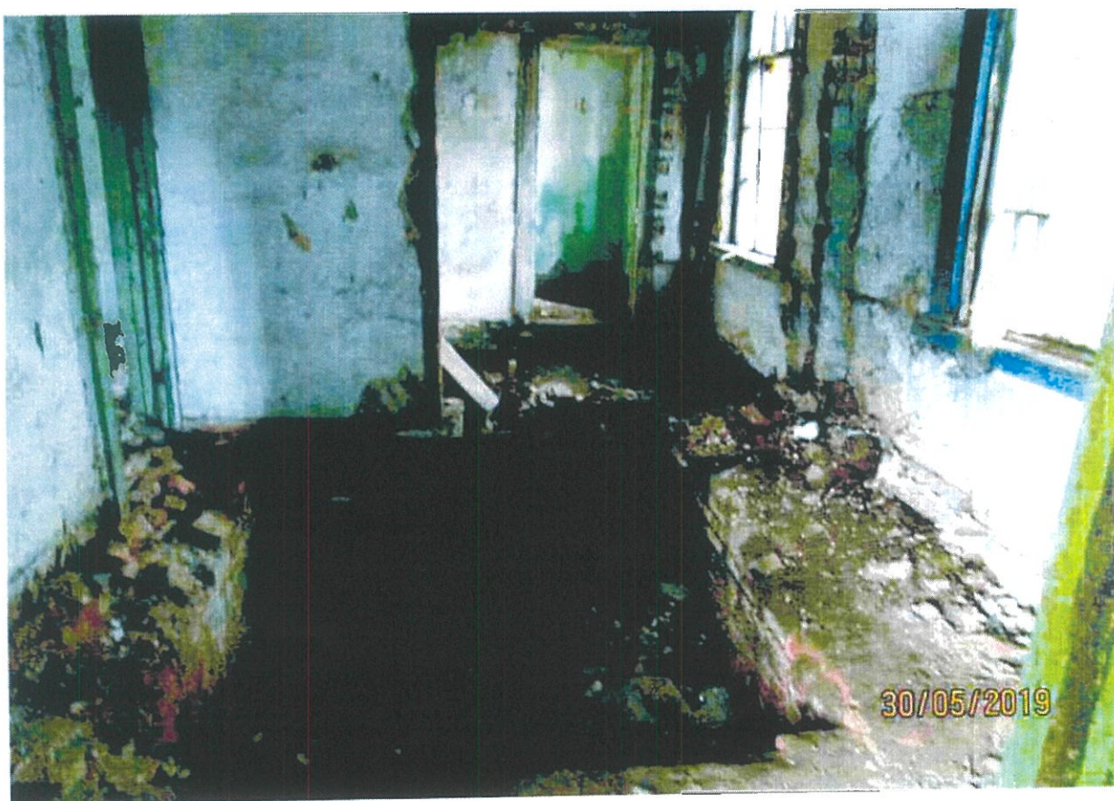
Фото 14. Помещения завалены бытовым и строительным мусором