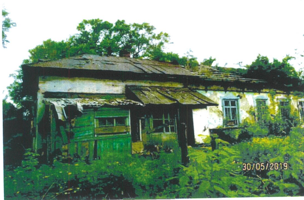
Фото 2. Северо-восточный фасад