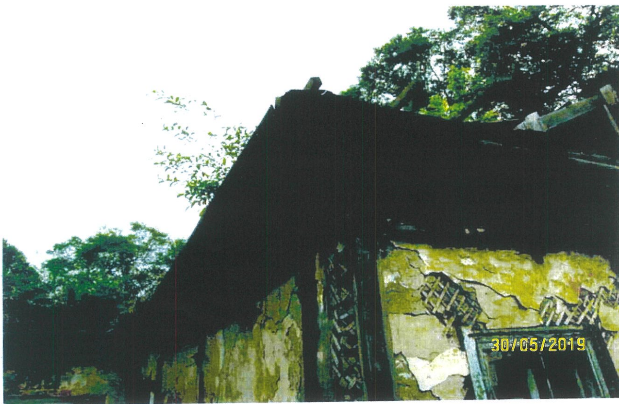
Фото 8. Разрушение карниза, кровельного покрытия, штукатурного слоя по стенам