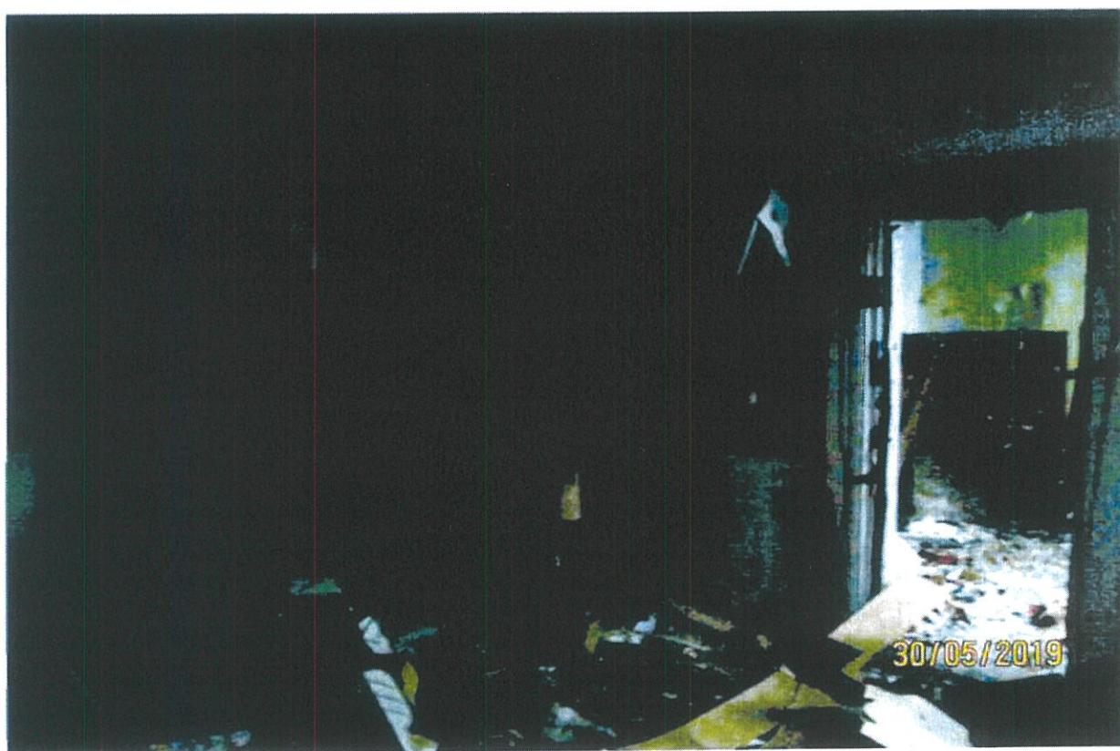
Фото 13. Помещения завалены бытовым и строительным мусором