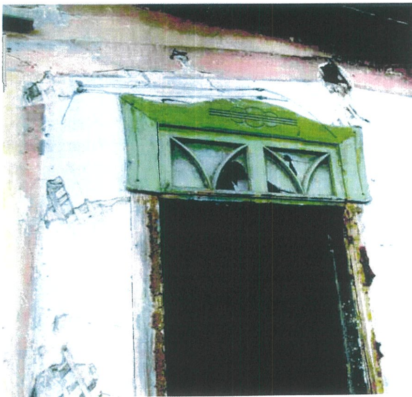
Фото 11. Фрамуга над дверным проемом главного входа