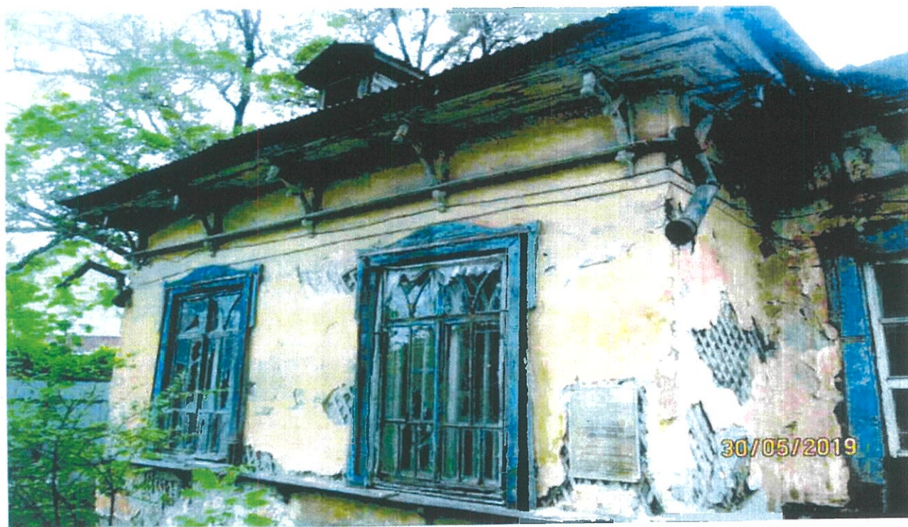
Фото 6. Фрагмент север-восточного фасада с сохранившимся заполнением оконных проемов и информационной надписью на объекте культурного наследия