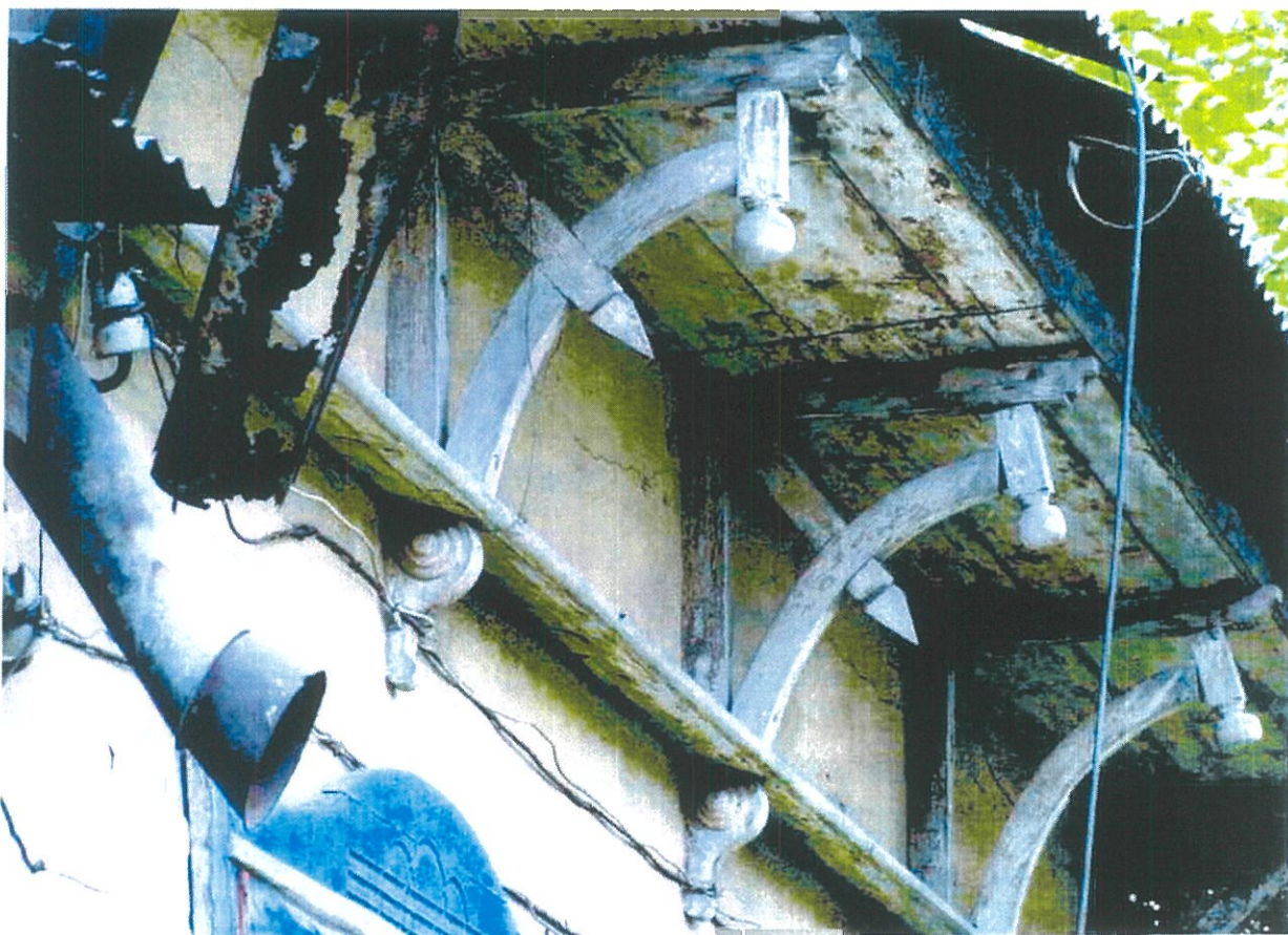
Фото 7. Фигурные деревянные кобылки, поддерживающие карниз