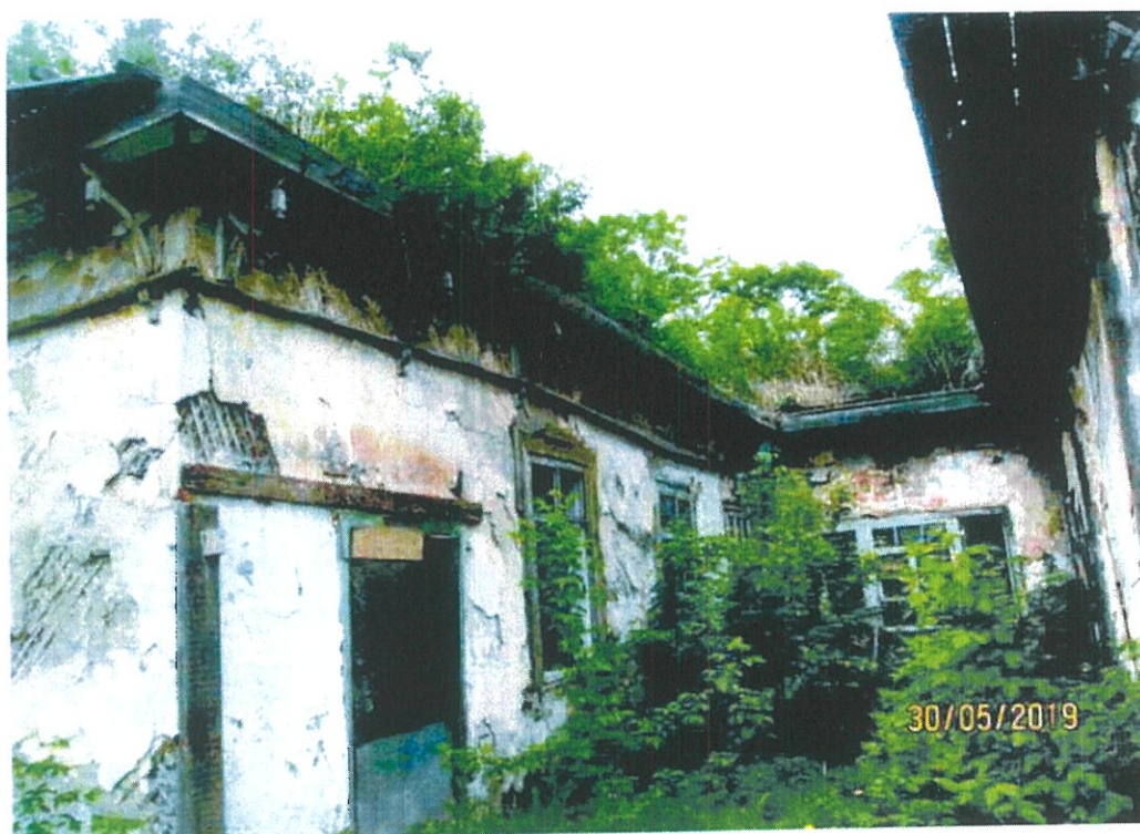
Фото 4. Фрагмент северо-западного фасада